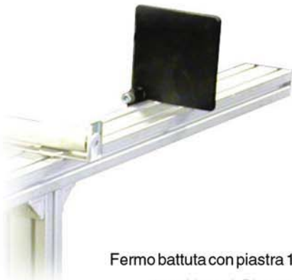
Fermo battuta con piastra 150x150 Anschlag mit Platte 150x150