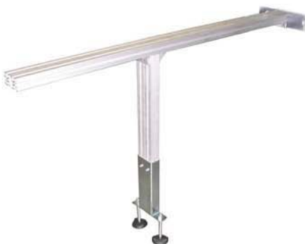
Sostegno profilo da 1500mm Sx+Dx Profilaufgabe 1500 mm Links + Rechts