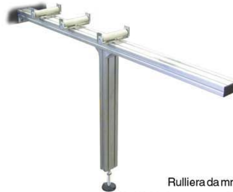
Rulliera da mm 1500 Sx+Dx Rollenbahn 1500 mm Links + Rechts