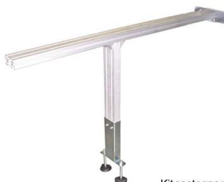
Kit sostegno profilo L=3000 Satz Profil-Unterstützungsarme L=3000