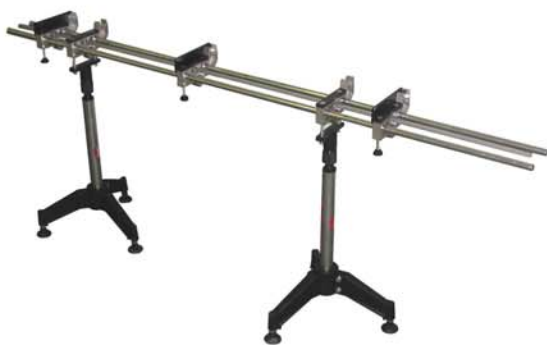
MSS/V Supporto laterale per calibro MSS/V Seitliche Ständer für Lehre